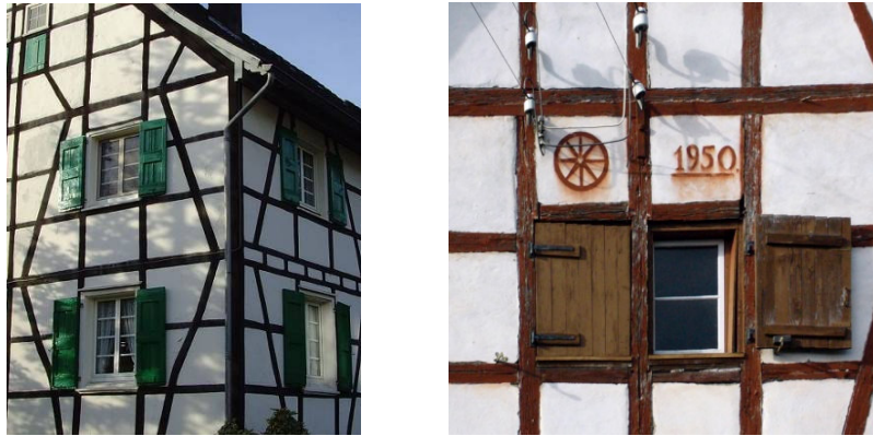
Figura 3 – Esempi di realizzazioni “Fachwerk”

Questa tecnica costruttiva consiste nella realizzazione di un telaio di elementi in legno massiccio di sezione ridotta che viene poi tamponato con diversi materiali (mattoni, pietra, argilla). Edifici di questo tipo sono molto diffusi in aree geografiche dove il materiale legno è disponibile in minore quantità come in Europa dell’Est, Inghilterra, Germania settentrionale, Danimarca, Olanda. I tempi di realizzazione di questo sistema costruttivo sono molto lunghi in quanto le lavorazioni sono molto complesse.