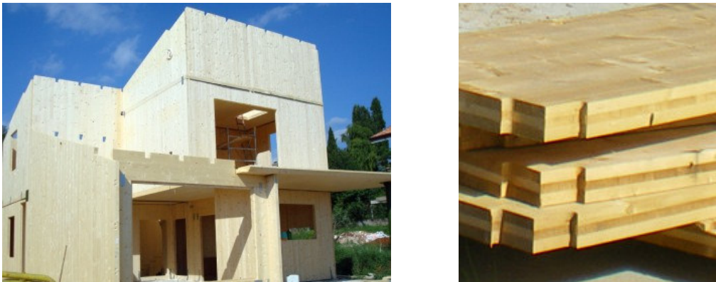
Figura 2 – Struttura ed elementi X-lam

Questo tipo di sistema costruttivo rientra nella categoria degli edifici di tipo massiccio in quanto le pareti sono realizzate mediante l’incollaggio di più strati di tavole di legno di spessore ridotto (15-40mm) che vanno a formare il pannello. Si tratta di elementi bidimensionali formati da tre, cinque o sette strati di tavole, dove ciascun strato è posto a 90° rispetto a quello adiacente e le tavole sono unite tra loro testa contro testa con “giunti a dita”. Si tratta di un sistema costruttivo sviluppato in tempi recenti e che oggi sta avendo grande diffusione.