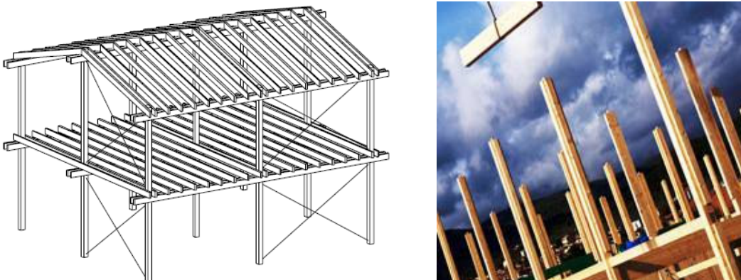
Figura 4 – Strutture a telaio

Il sistema a telaio è composto da una struttura di travi e pilastri in legno. Le pareti non sono quindi elementi portanti ma fungono da tamponamento. Gli interassi tra le travi e i pilastri possono essere notevoli e permettere così una grande libertà nella distribuzione degli spazi interni e la realizzazione di ampie aperture in facciata. La libertà compositiva dell’edificio deve comunque rispettare una regolarità in pianta dettata dal telaio resistente. Quest’ultimo definisce la posizione dei pilastri e il loro interasse e quindi di conseguenza anche le luci dei solai.