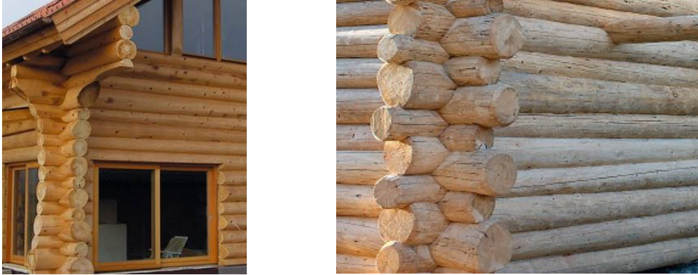
Figura 1 – Esempi di realizzazioni “Blockbau”

Si tratta della tecnica costruttiva più antica che consiste nella realizzazione di pareti massicce tramite la sovrapposizione di elementi di legno tondo. Le pareti così realizzate assolvono sia la funzione portante che quella di irrigidimento. Il collegamento degli elementi massicci all’angolo dell’edificio avviene tramite intagli o connessioni di carpenteria classica. Oggi gli elementi tondi vengono sostituiti con elementi di legno squadrato realizzati con nuove tecnologie, grazie anche all’utilizzo di macchine a controllo numerico che permettono una realizzazione precisa sia degli elementi che degli incastrati.