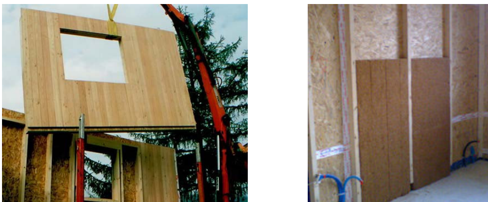
Figura 5 – elementi e struttura intelaiata

Questo sistema costruttivo può essere suddiviso a sua volta in due tipologie che sono: il “Baloon Frame” ed il “Platform Frame”. Nel primo caso i montanti verticali sono continui dalla fondazione alla copertura ed il solaio è direttamente collegato ad essi; si tratta di un sistema diffuso soprattutto in America. Nel secondo caso i montanti verticali vengono interrotti ad ogni piano, le pareti vengono costruite piano per piano ed interposti i solai. Tale sistema è il più diffuso al mondo: in Canada, in tutti gli Stati Uniti e nei Paesi del Nord Europa il maggior numero di edifici è costruito con questo sistema.